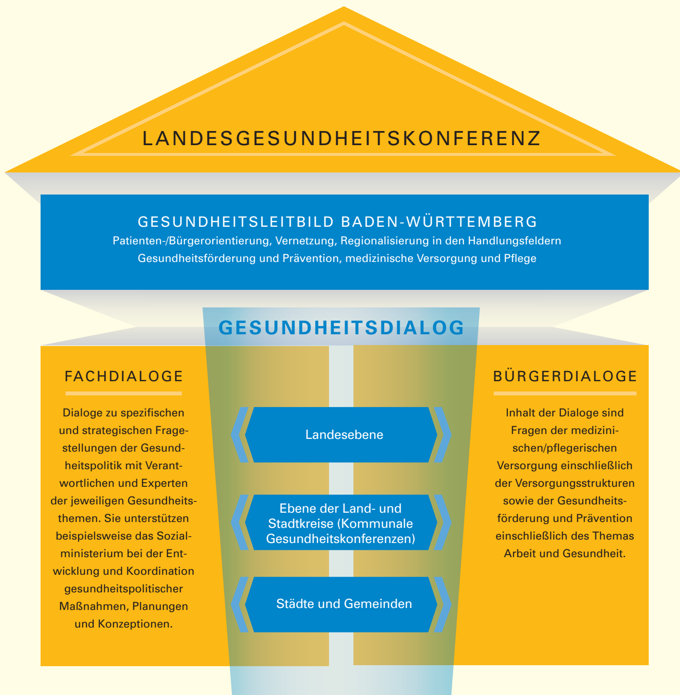
Abbildung 1 | Gesundheitspolitik in Baden-Württemberg – Zukunftsplan Gesundheit